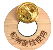
SDGsへ取り組むことを表明する、間伐材でできたバッジ。