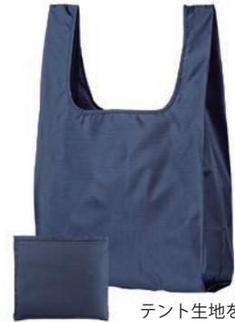
テント生地を使った、1ランク上のエコバッグも。

本誌第25号のプラスチック製ストローを減らす取り組みでも触れましたが、現在、海へ流出したマイクロプラスチックによる海洋汚染が深刻化しています。2019年G20大阪サミットでも海洋汚染を減らしていくことが決定されており、今回のレジ袋有料化も、プラスチックごみを減らす取り組みの一環です。